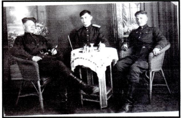
На память от сослуживцев, Май 1945г.