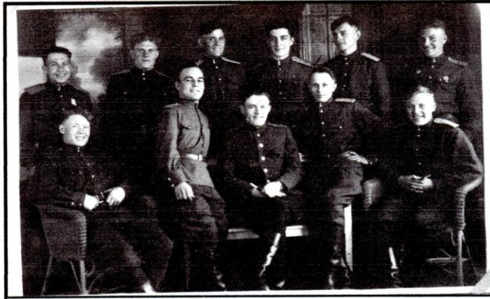
Они победили, дошли до Берлина