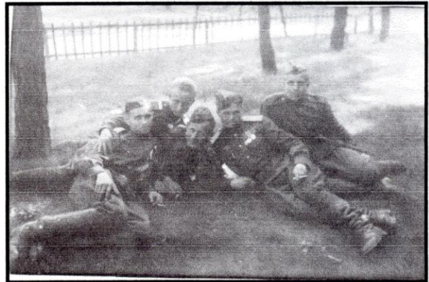
Редкие минуты отдыха