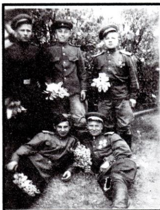
В освобожденной Польше