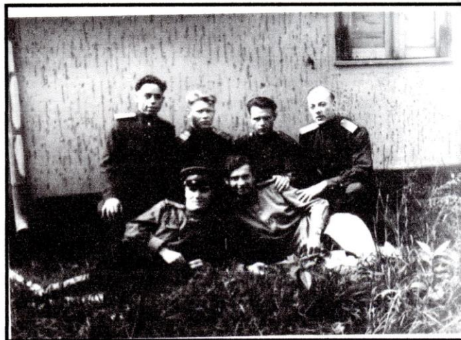
Дед и его боевые товарищи в Германии, 1945 г.